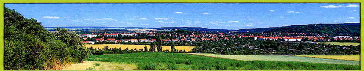
Blick auf Arnstadt, dem "Tor zum Thüringer Wald"

wie in jedem Jahr findet auch 2015 unsere traditionelle Herbstfahrt statt. Wir laden in diesem Jahr recht herzlich zu einer Fahrt in die Umgebung von Arnstadt ein. Für unsere Tagesfahrt am Samstag, dem 17. Oktober 2015 , haben wir folgendes Programm zusammengestellt: