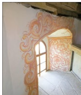
fortgeschrittene Restaurationsarbeit Kirche Schwansee