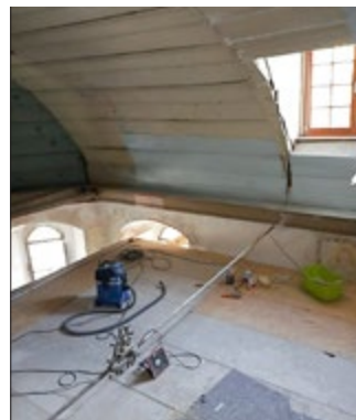
Arbeiten in Kirche Schwansee

Kaum zu glauben, das Jahr 2021 ist unlängst fortgeschritten. Und doch können wir nicht auf diesjährige vergangene Veranstaltungen zurückblicken. Keine Bastelvormittage mit den Kindern unserer Gemeinde, kein Frühlingfest oder Sammelaktion. Sicher, wir werden wieder Fahrt aufnehmen, und auch unsere Filmpicknick-Veranstaltungen sind geplant und werden nach heutigem Stand zu den bereits bekannt gegebenen Daten stattfinden. Aber dennoch fühlen wir uns etwas zurückgestellt und fast schon ein wenig abgehängt. Obwohl wir so viele Ideen haben und es sicherlich auch nicht am Tatendrang scheitern sollte. Wir stehen in den Startlöchern und sind bereit, auch wenn wir nun schon die Sommerzeit erreicht haben, uns unseren Projekten zu widmen und zu starten. Gern mit Ihnen - seien Sie also herzlich zu unserem ersten Filmpicknick dieser Saison sowie den hoffentlich folgenden Aktionen eingeladen.