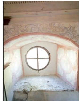
Einblick in die Restaurationsarbeiten Kirche Schwansee