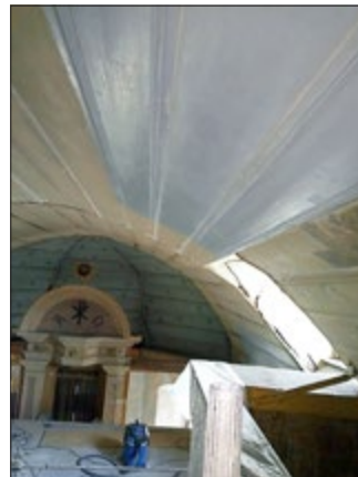
Deckentonne Kirche Schwansee