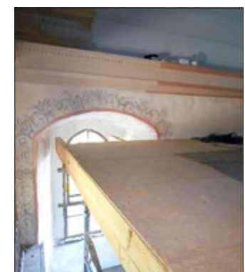
Konstruktionsarbeiten Kirche Schwansee