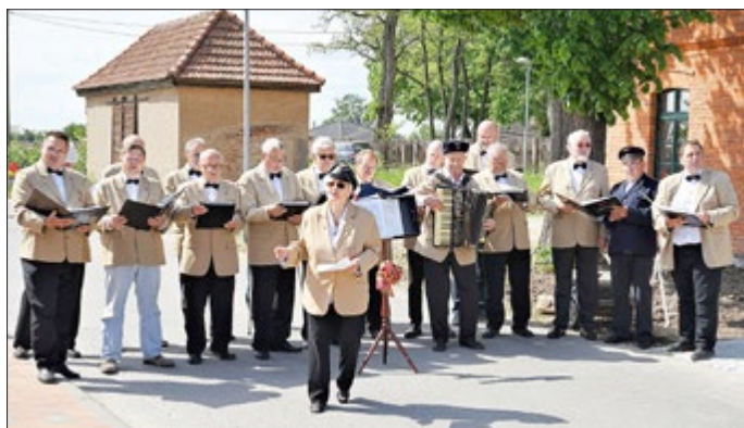
Der Männergesangsverein Liedertafel 1847 e. V.