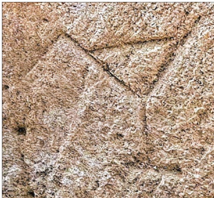
Das bisher älteste Steinmetzzeichen an einer Burg aus der Romanik in Thüringen wurde in Schloßvippach freigelegt