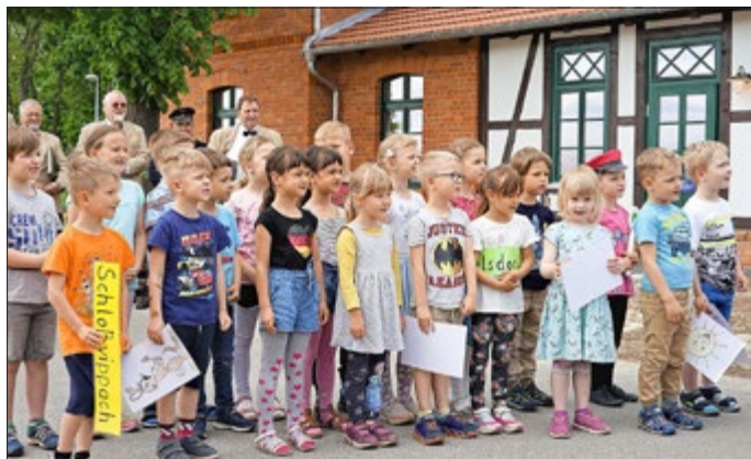
Die Kinder vom Kindergarten „Regenbogen“