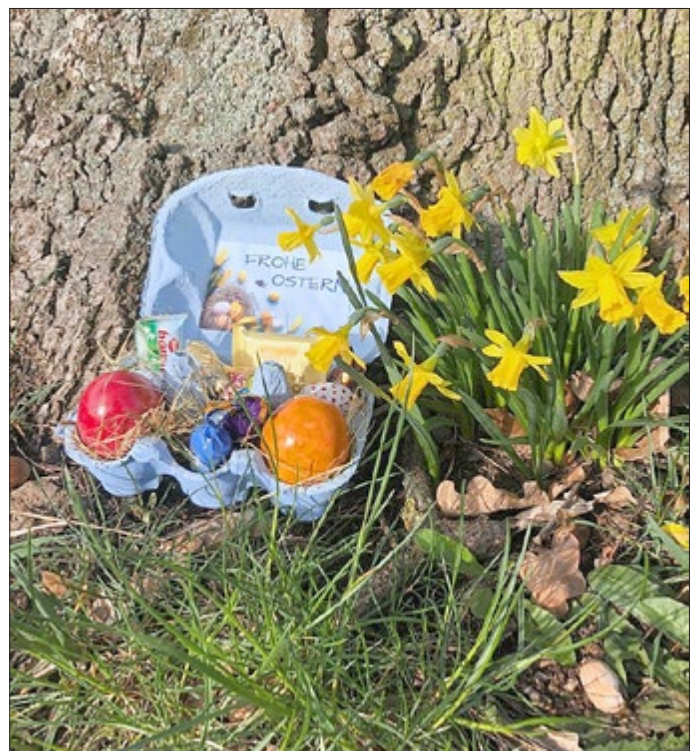
Kleine Osterüberraschung im Kirchgarten.