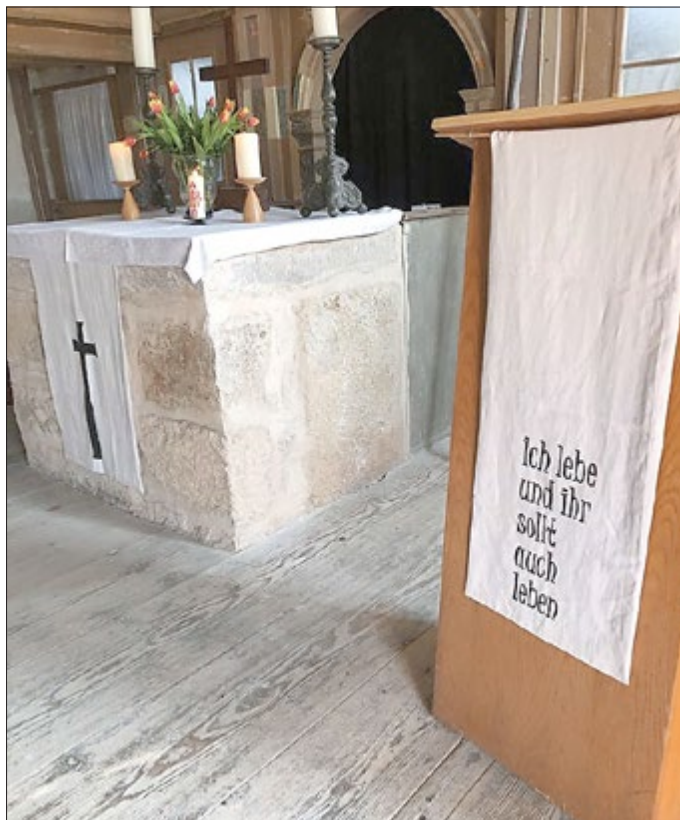
Ostersonntag zum Familiengottesdienst