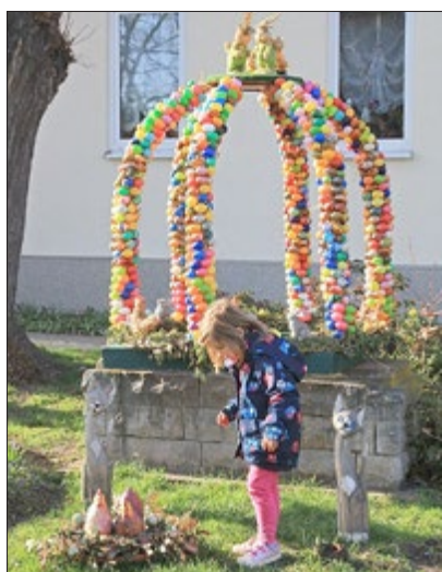
Die Kleinmölsener Landfrauen