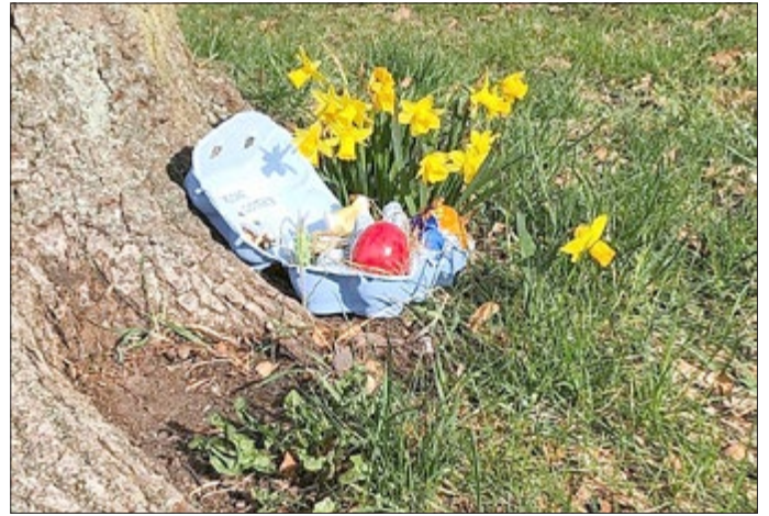
Ein Versteck im Kirchgarten Schwansee.