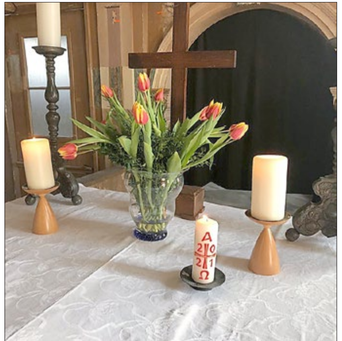
Vorbereitung der Kirche zum Familiengottesdienst an Ostern.