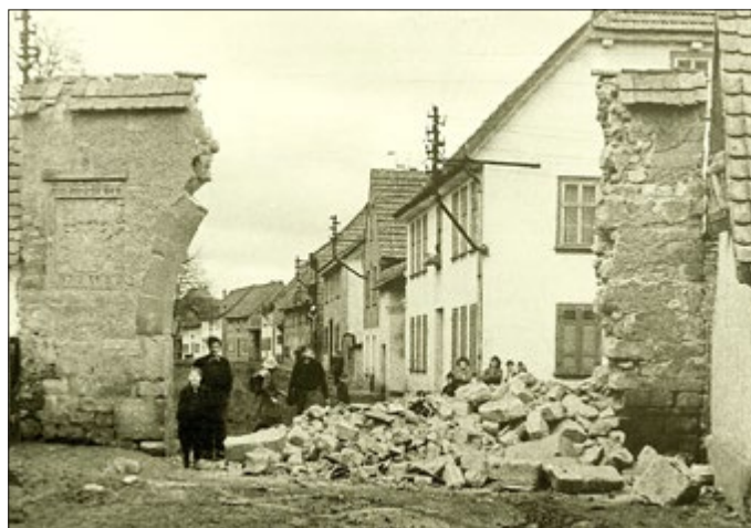
Die Reste der Außenseite nach dem Unfall, 28. Februar 1961. Die Wappentafel wurde beim Umbau 1911 auf die linke Seite versetzt, was sie 50 Jahre später vor den Unfallfolgen rettete.