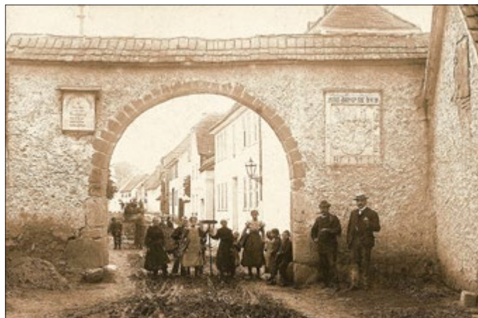
Originalzustand des Tores mit der Giebelfront von Haus Nr. 64 (rechts), 1907.